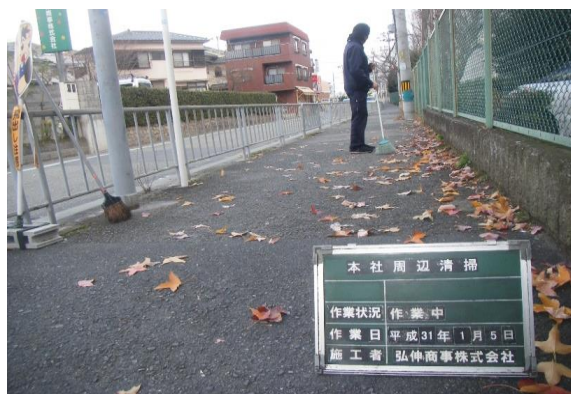
会社周辺清掃作業