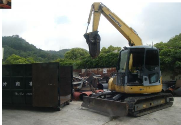
2018年台風21号 箕面市との災害救助協定 ボランティア活動