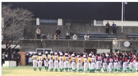
第4回弘伸カップ (社会貢献活動) 地域子供ソフトボール大会開催